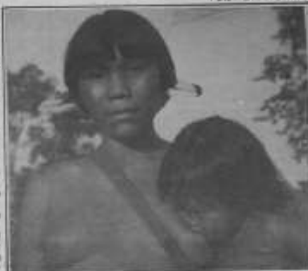
Grupos Yanomami da aldeia Maracá / AM, 1982.