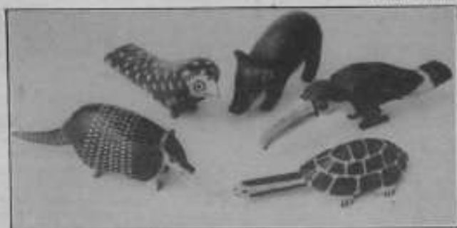
Brinquedos do grupo indígena Mbyá-Guarani (BR/ARG)